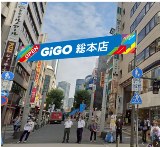
※イメージイラスト

オープンを記念して、9月16日（土）～10月5日（木）まで、サンシャイン60通りの街頭フラッグ13か所が「GiGO」カラーに染まります。また、期間未定でサンシャイン60通り商店街入口に「GiGO横断幕」が登場します。