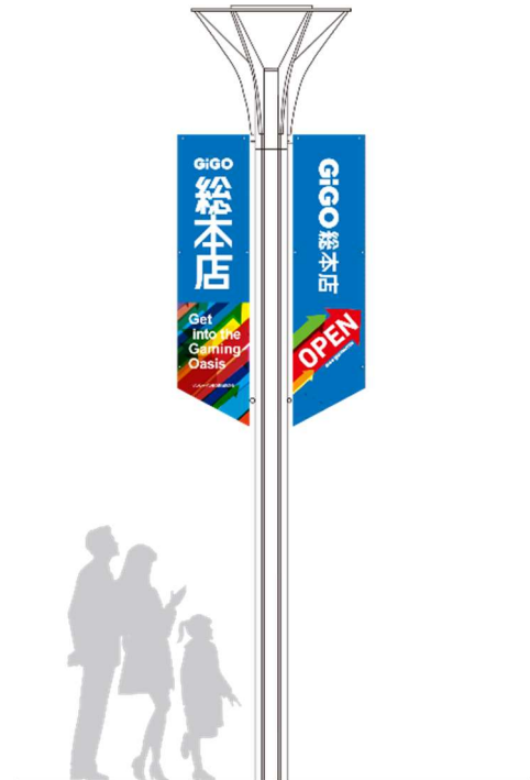
※イメージイラスト