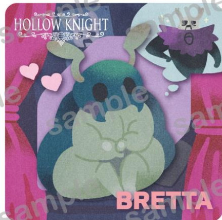
Hollow Knight © 2025 Team Cherry