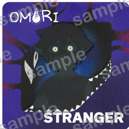
OMORI © OMOCAT, LLC 2025