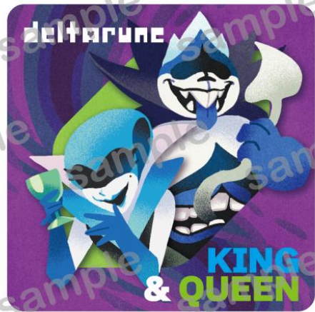
DELTARUNE © Toby Fox 2015-2025. All rights reserved.