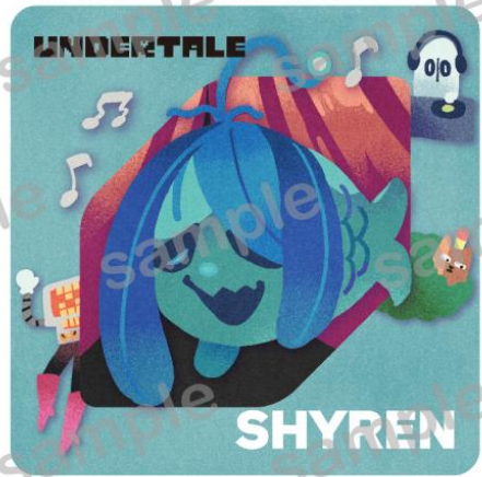
UNDERTALE © Toby Fox 2015-2025. All rights reserved.