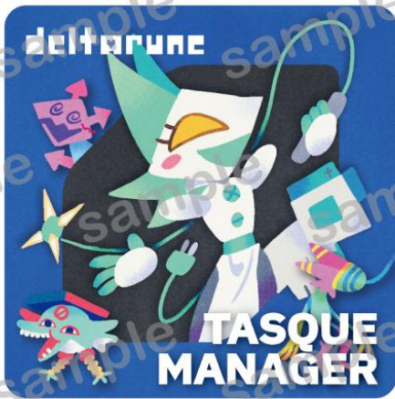
DELTARUNE © Toby Fox 2015-2025. All rights reserved.