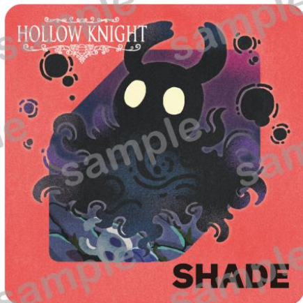
Hollow Knight © 2025 Team Cherry