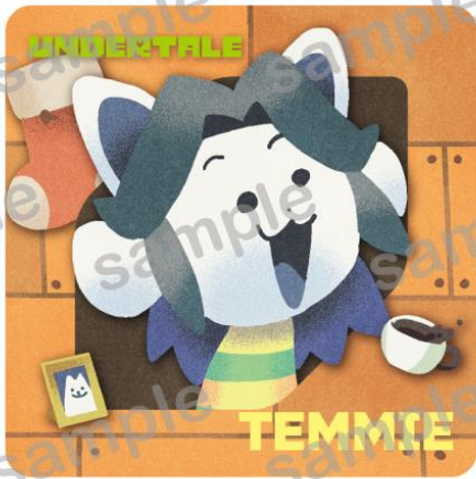
UNDERTALE © Toby Fox 2015-2025. All rights reserved.