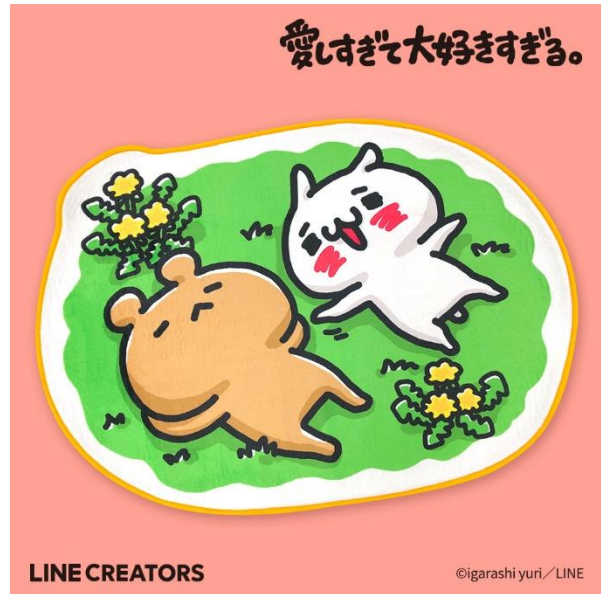
▲ 愛しすぎて大好きすぎる。ラグマット