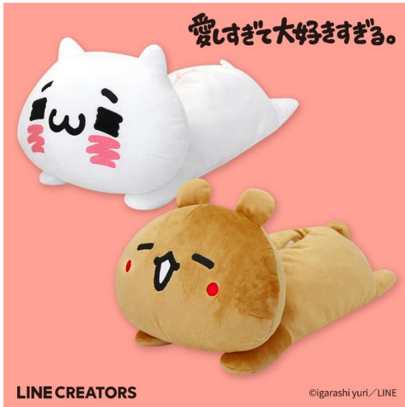
▲ 愛しすぎて大好きすぎる。ぬいぐるみティッシュカバ