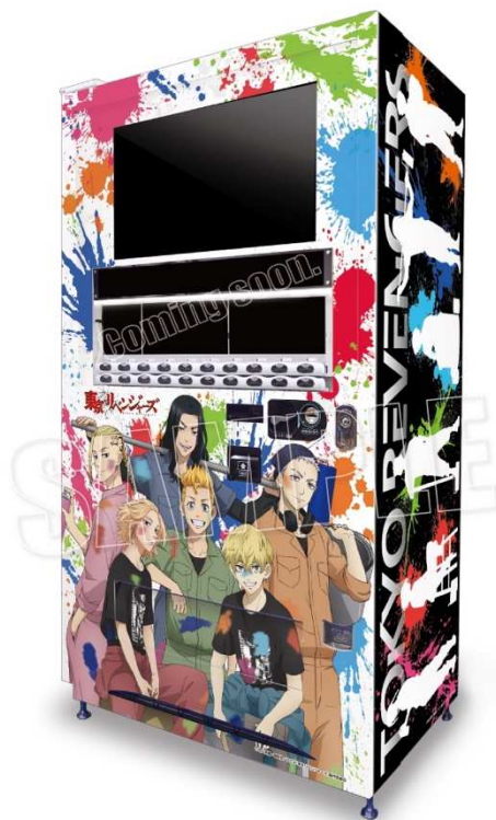
▲オリジナルラッピング自動販売機

※ ご購入方法に関する情報は、「セガ池袋 GiGO」公式Twitterより適時発信いたします。