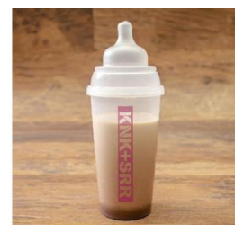
▲闇と狂気の哺乳瓶ドリンク 黒 チョコバナナ