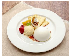
▲ポインポインプレート