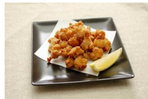
▲かしこくなる? なんこつ