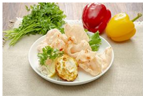
▲ガパオライスをもっと美味しくするトッピング♥