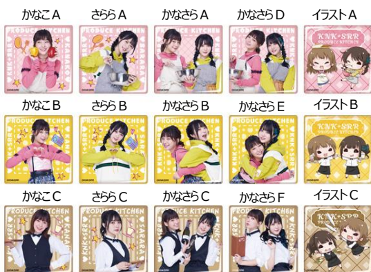
▲かなことさららプロデュースキッチン スクエアスカーフピン (全15種) 【サイズ】H約53mm×W約53mm