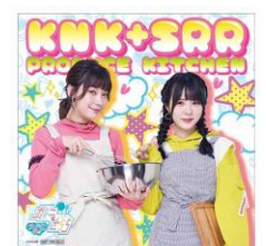
▲フードステッカー (全 1 種)