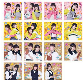
▲ドリンク&サイドメニューステッカー (全 15 種・ランダム)