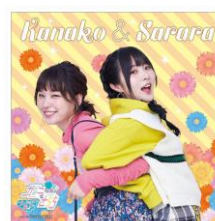
▲デザートステッカー (全 1 種)