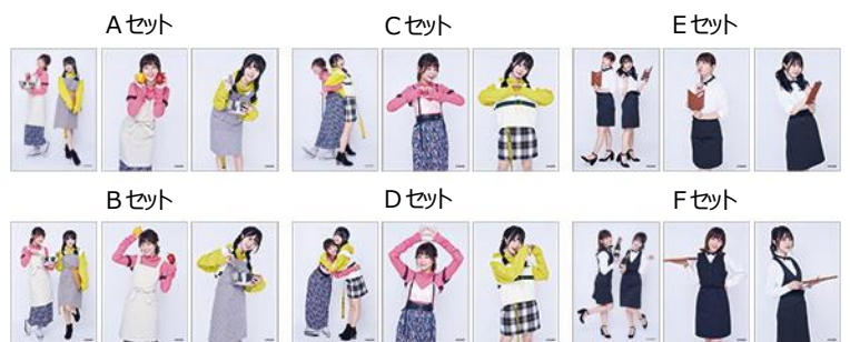
▲かなことさららプロデュースキッチン 撮り下ろしプロマイド 3枚セットA～F(全6種) 【サイズ】H約127mm×W約89mm