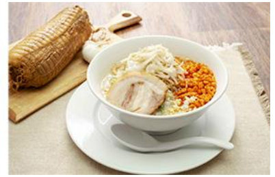
▲ちゃびの八郎ラーメン

※フードメニューはファーストオーダー時におひとり様いずれか 1 品のみご注文いただけます。