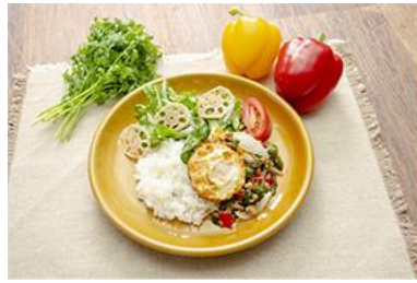
▲きんちゃんの世界平和ガパオ