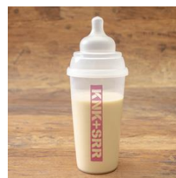
▲闇と狂気の哺乳瓶ドリンク 白 ほんのりミルクティー