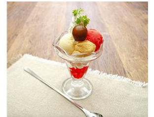
▲おそらく史上初梅干しを漬けた女性声優番組を記念した梅ぷふえ

※デザートメニューはファーストオーダー時におひとり様いずれか 1 品のみご注文いただけます。