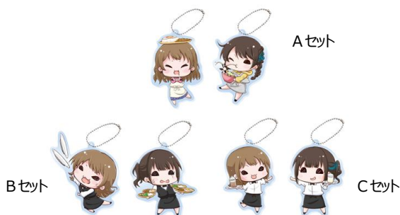
▲かなことさららプロデュースキッチン アクリルチャームペアセット (全3種) 【サイズ】H約100mm×W約60mm以内